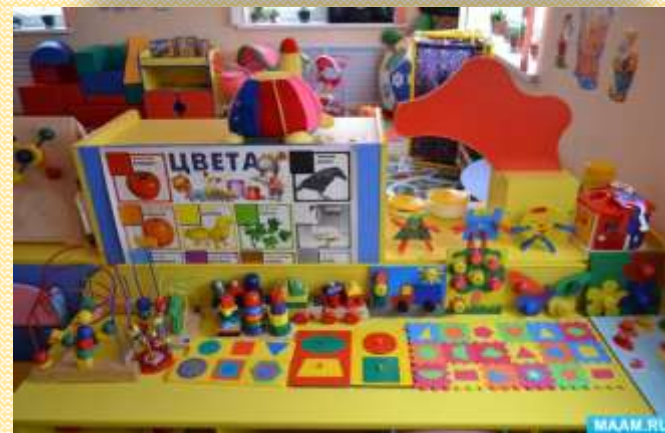
Центр сенсорного развития