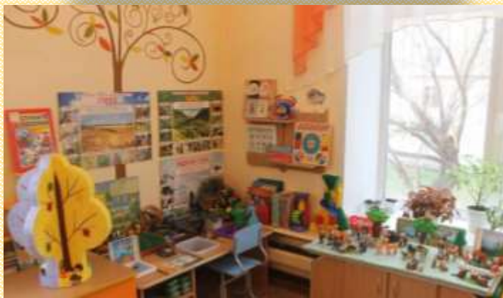
Центр «Уголок природы»