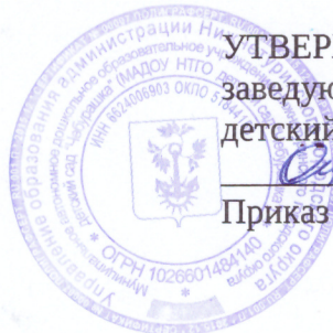
График проведения плановых заседаний психолого-педагогического консилиума (ППк) МАДОУ НТГО детский сад «Чебурашка» на 2024-2025 учебный год